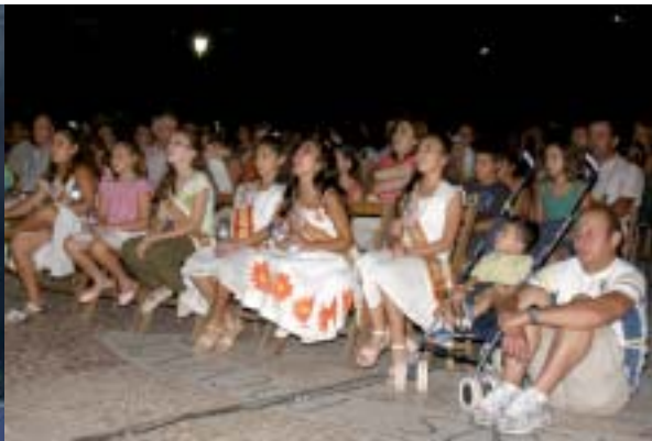
▲ El público infantil coreo con entusiasmo todos los temas de estos populares personajes