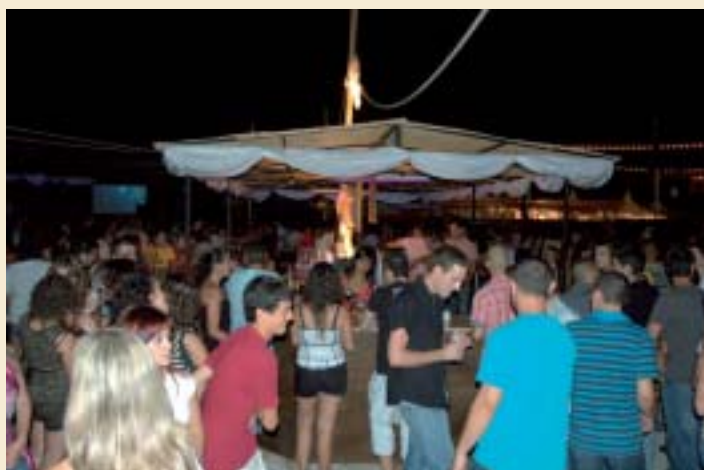
▲ King x Kal