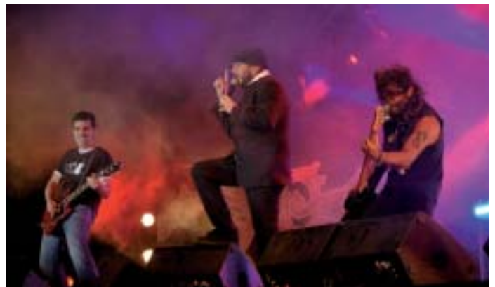
▲ El grupo Marea en plena actuación en las fiestas de Pinoso