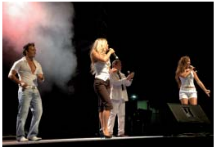
▲ Momento de la actuación de Decadance