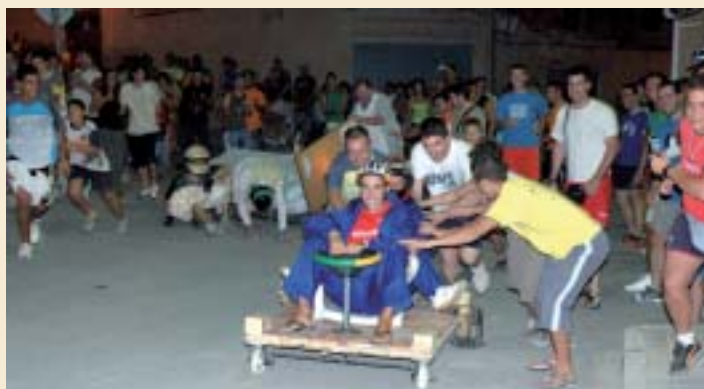
▲ L'ordre del glop fácil