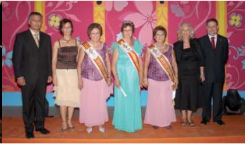
▲ La nueva reina y sus damas, con las autoridades, una vez acabado el acto