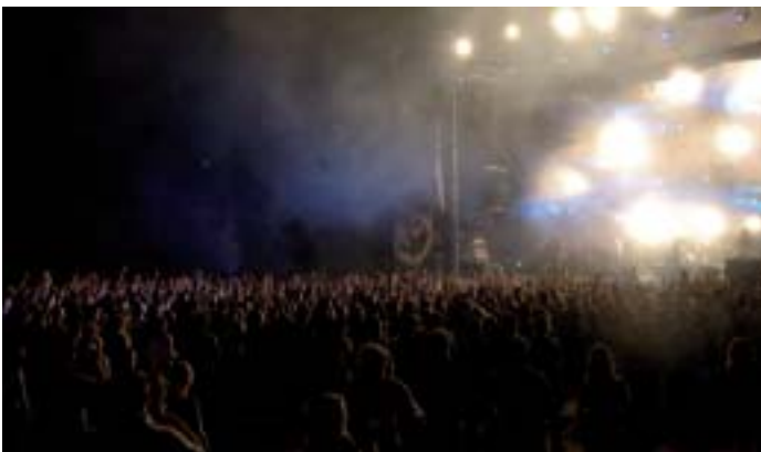
▲ Un público entregado disfruto del concierto de Marea