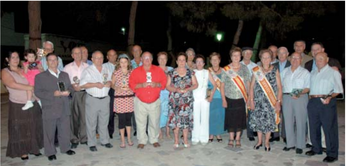
▲ Foto de familia de los premiados en los juegos de mesa de nuestros mayores

Al igual que en anteriores ocasiones, nada más tomar posesión de sus cargos, recibieron la felicitación de las representantes de las localidades vecinas invitadas al acto, así como de las reinas y damas del barrio de Santa Catalina y de la Feria y Fiestas, además de los representantes provinciales de la Unión Democrática de Pensionistas y las autoridades locales.