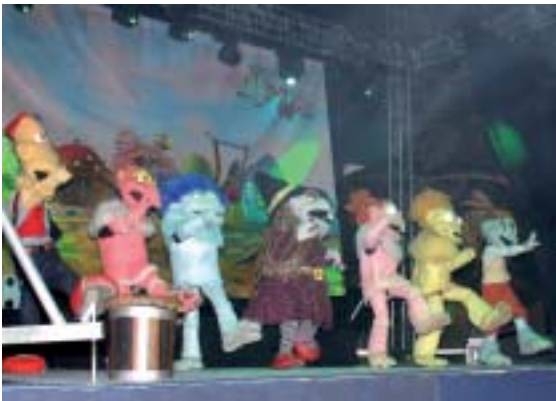
▲ Los Lunnis irrumpen en el escenario cantando una de sus populares canciones