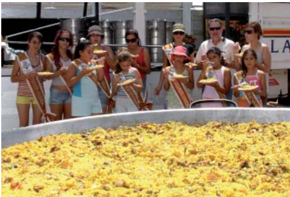
▲ Autoridades y reinas prueban la paella

No caben palabras para describir el poder de atracción que tiene el día de la paella gigante. Pinoseros y visitantes madrugan para poder coger sitio en el cauce del badén, para montar mesas y sillas y pasar una mañana de convivencia, con la excusa de probar un plato de paella. Y es que se ha convertido en uno de los actos más multitudinarios de la feria. Quienes acudieron pudieron probar el arroz elaborado por Galbis, empresa que es maestra en estas lides.