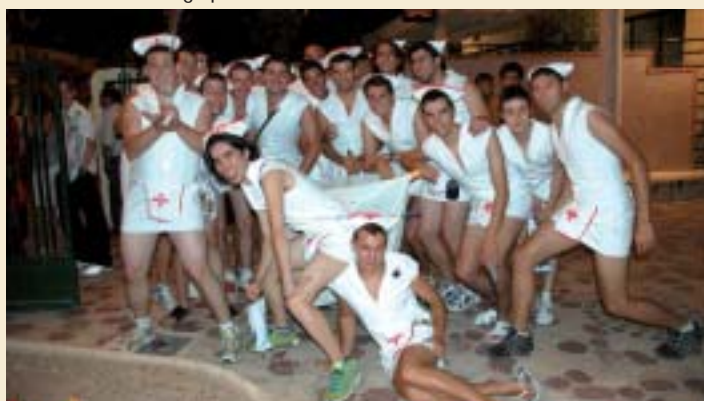
▲ Cap Limit