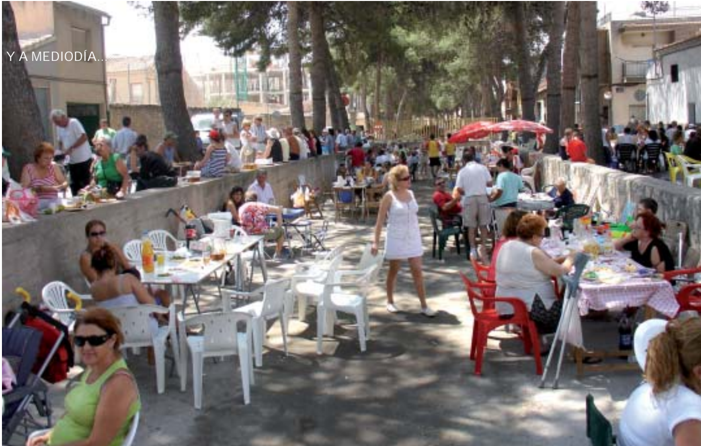
▲ Aspecto que presentaba el badén el 6 de agosto