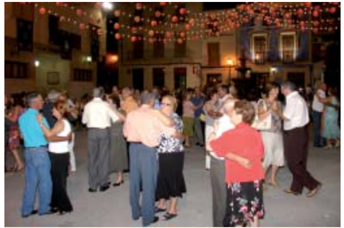
▲ La verbena del "Baile del Farolillo" volvió a llenar la plaza de España y sus alrededores

Las restantes verbenas, con menos afluencia de gente, tuvieron lugar en el jardín. Entre ellas, la que amenizó el grupo local "Amanecer" en la noche del 8 de agosto.