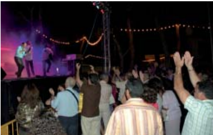
▲ En los instantes finales del concierto de Fórmula V el público se levantó a bailar

Mientras tanto, en el jardín, actuaba el grupo "Decadance", herederos de aquel grupo llamado "La década prodigiosa", del que queda algún componente, y que siguen recordando los éxitos musicales de los años 80.